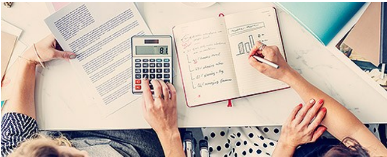
Юридические консультации и ведение бухгалтерии