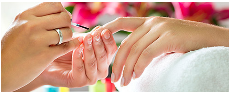
Оказание косметических услуг на дому