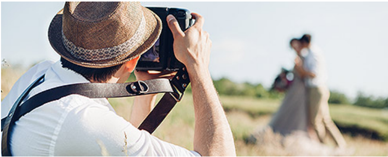
Фото- и видеосъемка на заказ