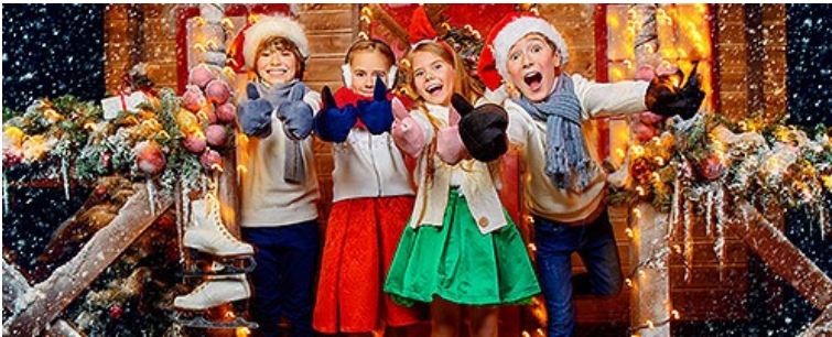
Проведение мероприятий и праздников