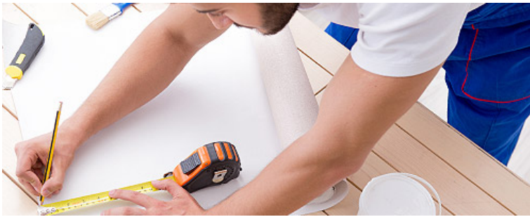
Строительные работы и ремонт помещений

Налог на профессиональный доход можно платить и при осуществлении других видов деятельности, если соблюдаются все условия, предусмотренные Федеральным законом № 422-ФЗ.