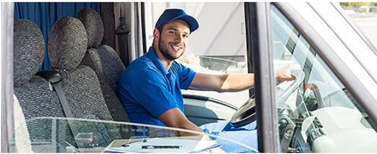
Услуги по перевозке пассажиров и грузов