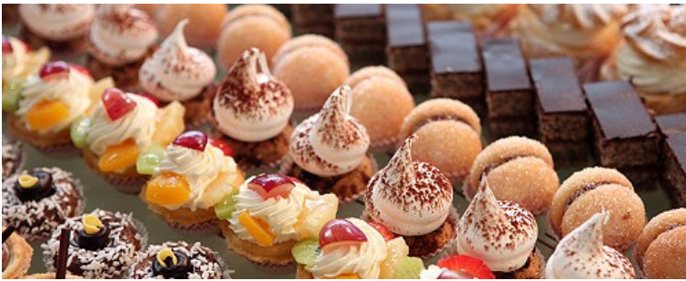
Продажа продукции собственного производства